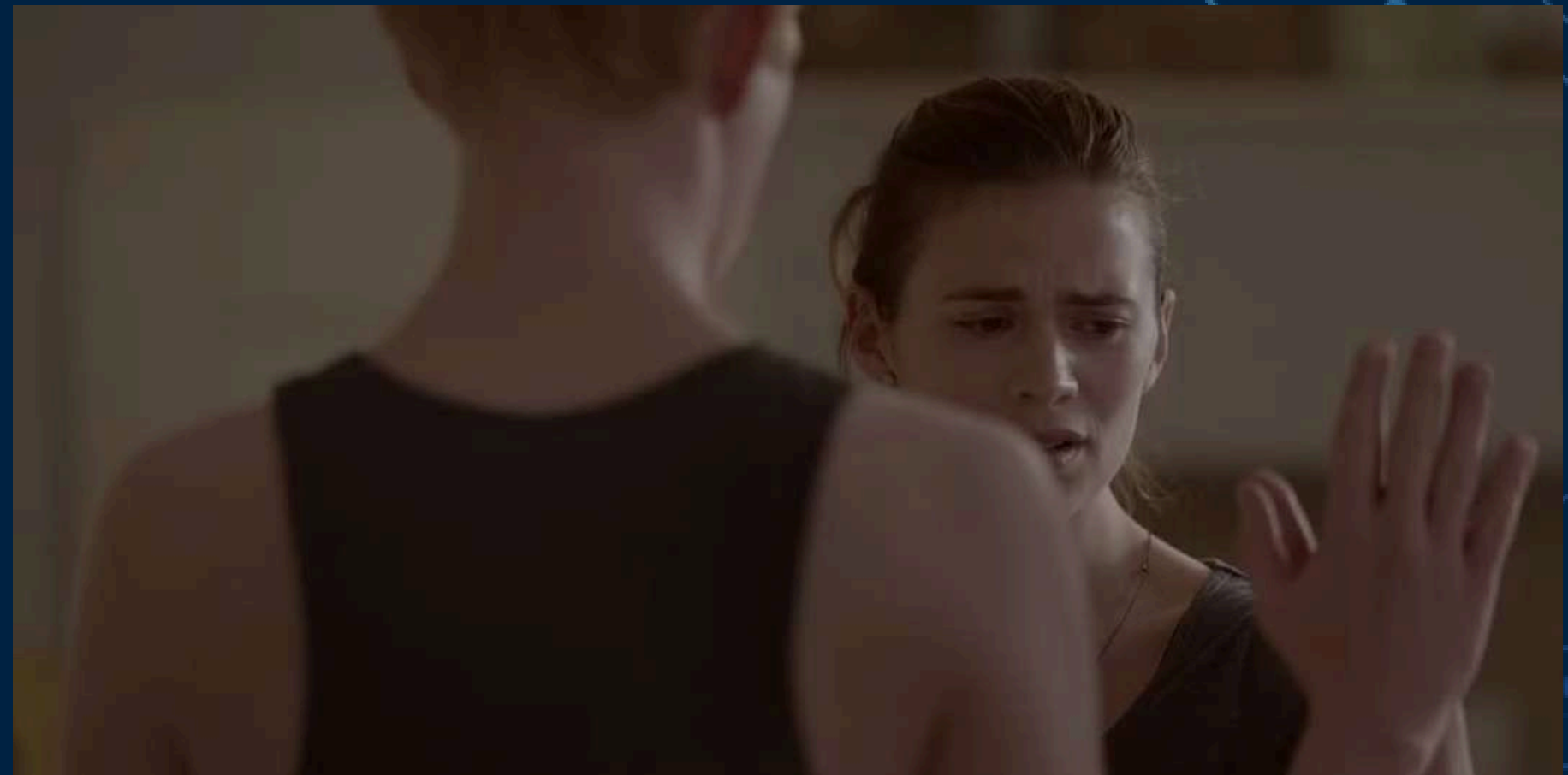
BE RIGHT BACK DE OWEN HARRIS (BLACK MIRROR SEZEOI)