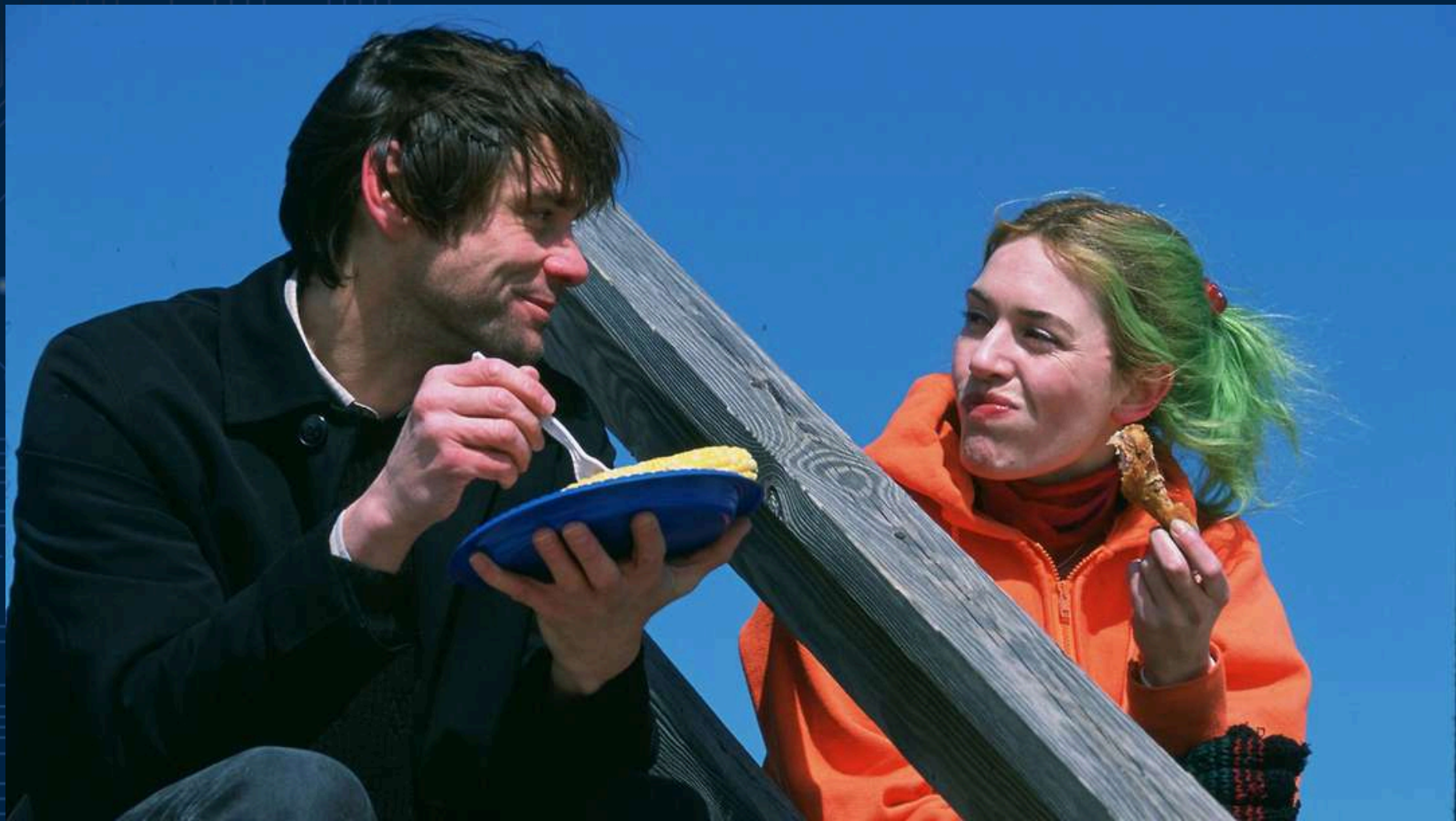
ETERNAL SUNSHINE OF A SPOTLESS MIND DE MICHEL GONRY